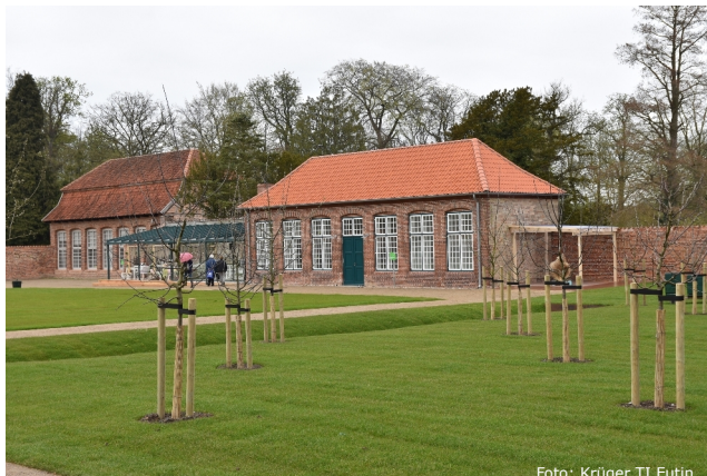
Küchengarten & Neuholländerhaus